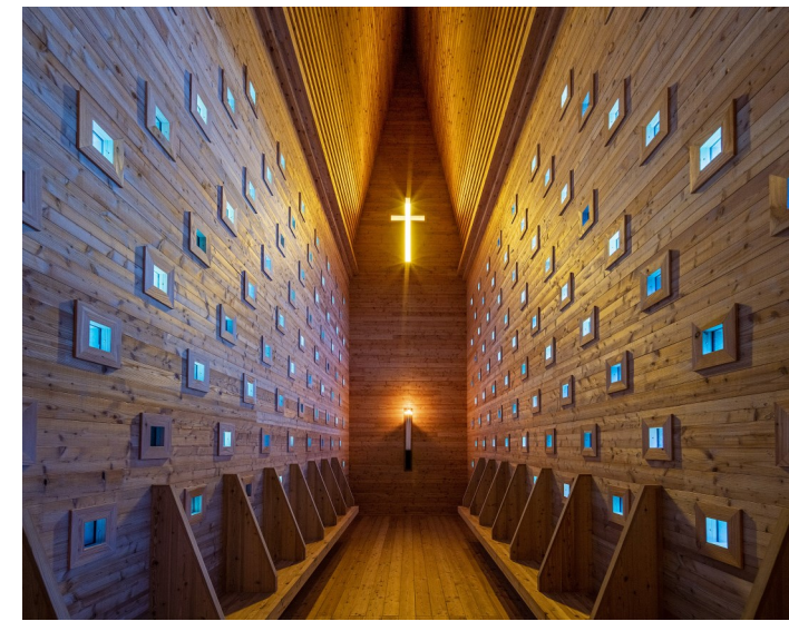
Innenansicht der Kapelle Oberthürheim

Evang.-Luth. Kirchengemeinde Pfronten VR Bank Augsburg-Ostallgäu eG Verwendungszweck: Ökum. Wallfahrt 24 + Name IBAN: DE19 7209 0000 0009 6069 98